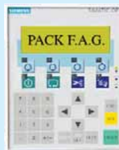
Pannello di controllo Simatic OP7