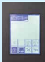
Touch panel modello Pro Face